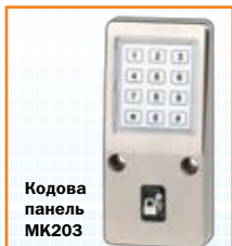
Кодова панель МК203