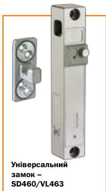
Універсальний замок – SD460/VL463

Продукція Knock N`Lock має універсальне застосування і тому дозволяє побудувати комплексну систему безпеки, яка не має обмежень! Спектр застосування – двері приміщень, контейнери, сейфи, комерційні автомобілі, банкомати, платіжні термінали і т.д.