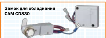
Замок для обладнання CAM CD830

Додай до циліндра Knock N`Lock якісний замок і фурнітуру та отримай Комплексне рішення контролю доступу.