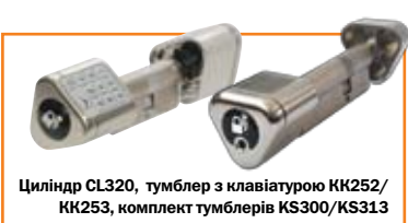
Циліндр CL320, тумблер з клавіатурою KK252/ KK253, комплект тумблерів KS300/KS313