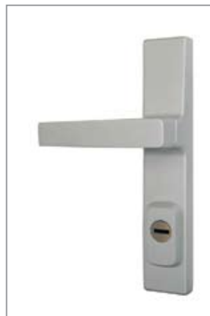
ROSTEX R4 Office