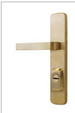
ROSTEX R4 Astra Ti/mat

Захисна фурнітура ROSTEX® застосовується з багатоспрямованими замками MUL-T-LOCK® M265 та M603, з основними замками MUL-T-LOCK® SASHLOCK та з замками інших виробників з міжосьовою відстанню 72 мм, 85 мм, 90 мм. Наявність міжкімнатної фурнітури OFFICE дозволяє отримати єдиний дизайн як вхідних, так й міжкімнатних та сантехнічних дверей.