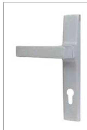
ROSTEX Office PZ