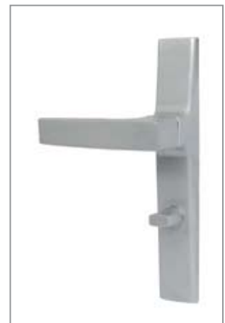
ROSTEX Office WC